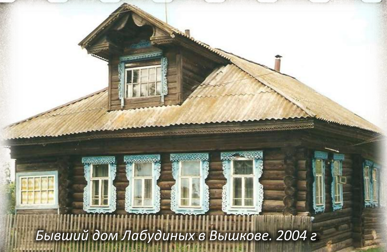
Бывший дом Лабудиных в Вышкове. 2004 г