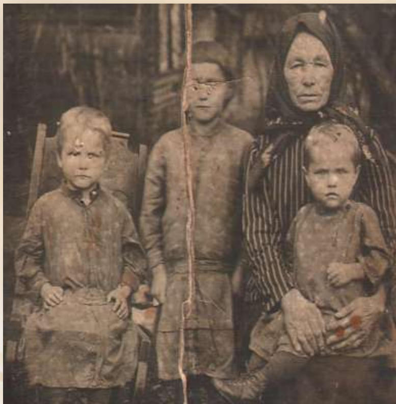
На фото: бабушка с внуками