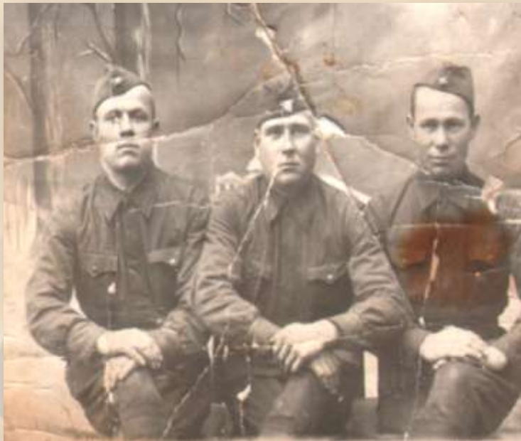
На фото: брат Михаил на фронте с боевыми товарищами.

Помню, как в 1941 году в Микшине было видно зарево: горел в огне Калинин. Мы различали гул немецких самолетов, прятались в снежных сугробах, когда они приближались. Из нашей деревни 20 человек не вернулись с войны. А возвратившихся солдат встречали всей деревней. Вернулись и отец с братом. Отец - весь израненный, а брат - инвалид: у него не работала левая рука. За свой труд я была награждена медалью «За доблестный труд в Великой Отечественной войне 1941 – 1945 гг.» и юбилейными медалями. Имею удостоверение «Ветеран Великой Отечественной войны».