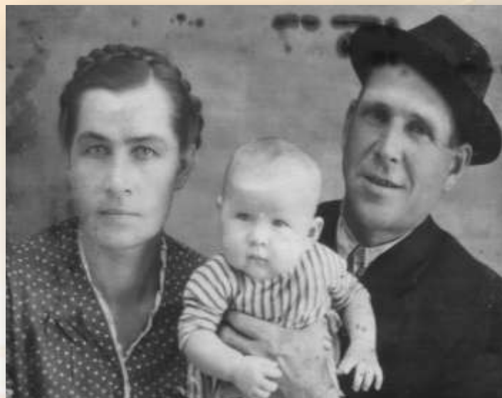
На фото: брат Михаил с женой и дочкой.

Помню, как в 1941 году в Микшине было видно зарево: горел в огне Калинин. Мы различали гул немецких самолетов, прятались в снежных сугробах, когда они приближались. Из нашей деревни 20 человек не вернулись с войны. А возвратившихся солдат встречали всей деревней. Вернулись и отец с братом. Отец - весь израненный, а брат - инвалид: у него не работала левая рука. За свой труд я была награждена медалью «За доблестный труд в Великой Отечественной войне 1941 – 1945 гг.» и юбилейными медалями. Имею удостоверение «Ветеран Великой Отечественной войны».