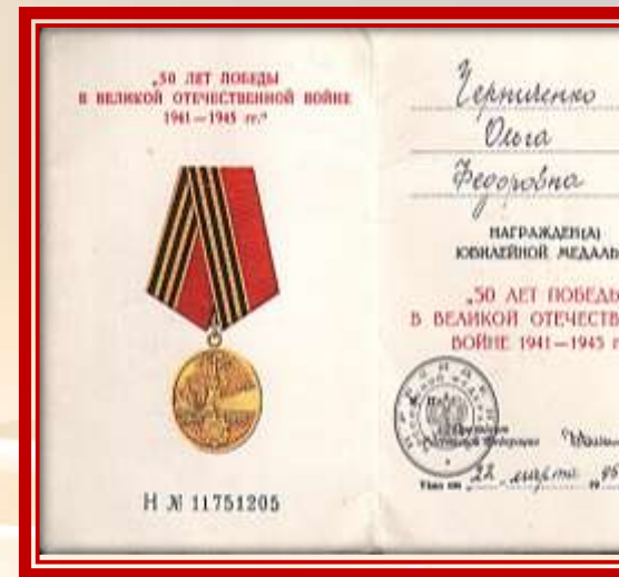
Документы из архива О.Ф. Черниченко