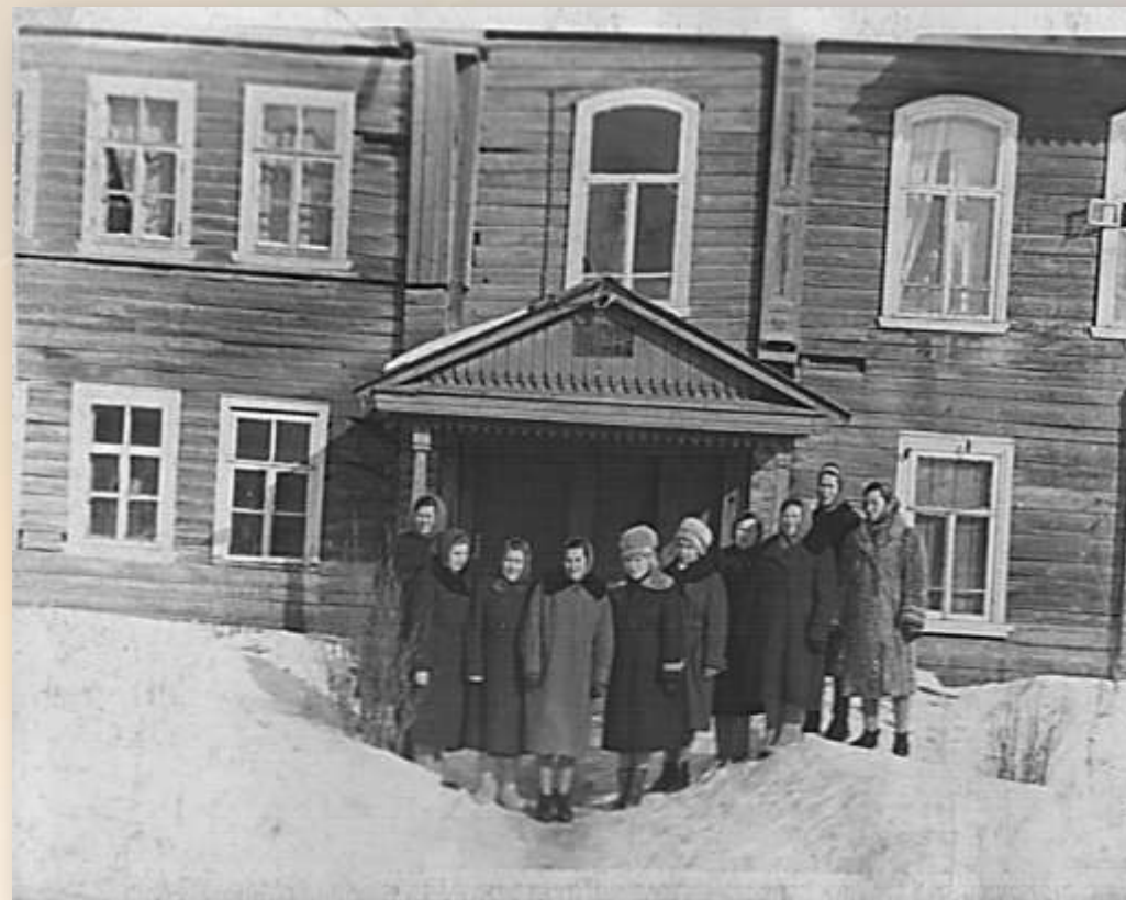
Село Микшино. Здание школы (слева ) и больницы (справа), где в 1941 году располагался военный госпиталь. Фото 1960-70-х гг.