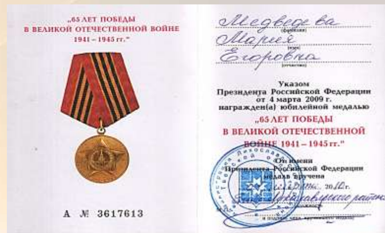
Фото из семейного альбома и документы их архива М.Е. Медведевой.