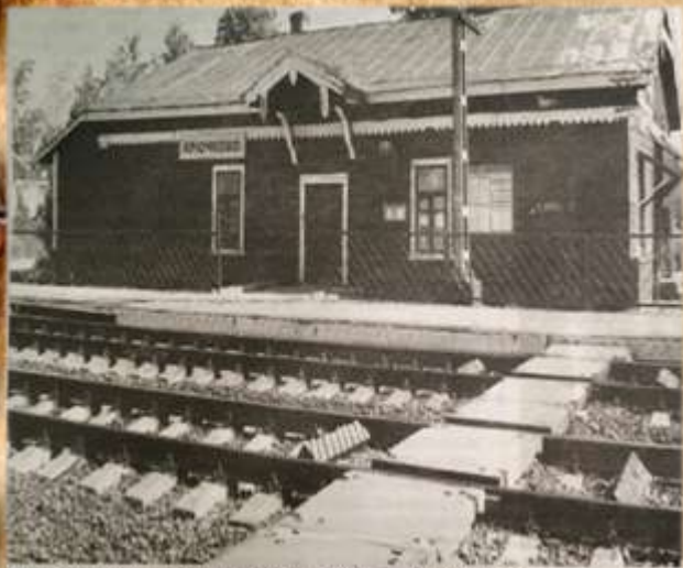
Вокруг станции вырос поселок. На снимке – здание вокзала