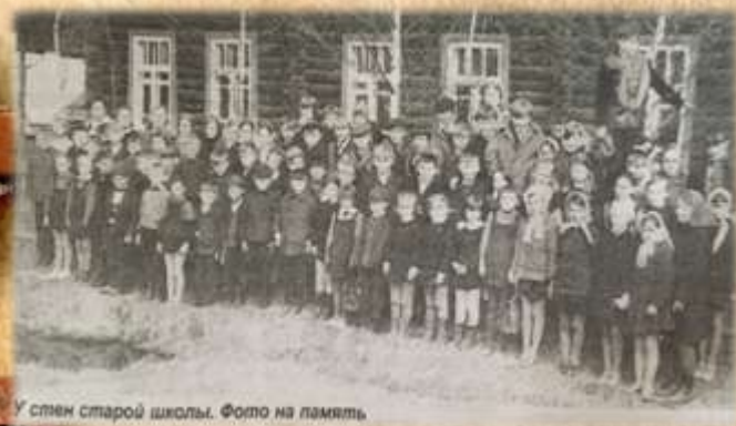
У стен старой школы. Фото на память.

В годы Великой Отечественной войны Лихославльский район оказался в прифронтовой полосе. Враги стремились вывести из строя железную дорогу. Станции и мосты подвергались ожесточенным бомбовым ударам. Фашистские самолеты не раз сбрасывали бомбы и на Крючково. Частым бомбежкам поселок подвергся в октябре 1941-го, в марте 1942 года. Погибали и получали ранения люди, были разрушены склады, зернохранилище, почта, клуб, контора хозяйства, столовая, пекарня и другие строения.