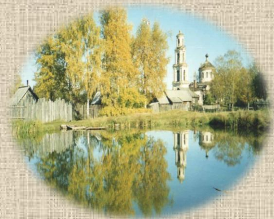
Сегодня Толмачевский храм вновь действует.