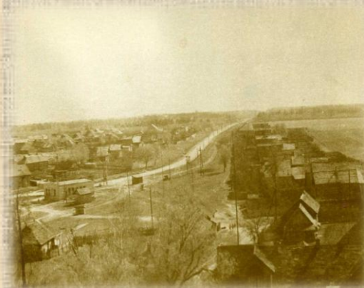
Улица в с.Толмачи