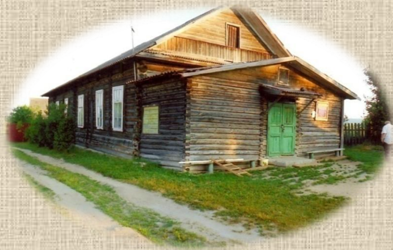
Гнездовский клуб размещался в перевезённой от кладбища в центр деревни церкви

Впоследствии колокольня была разрушена до основания, но ценности так и не нашли.