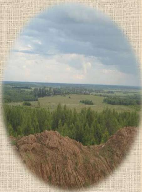
Вид с бывшего холма близ д. Данильцево

Похожая легенда существует и в деревне Вёски. Только в этой местности говорили, что где-то под Вёсками вместе с князем похоронены и воины его дружины.