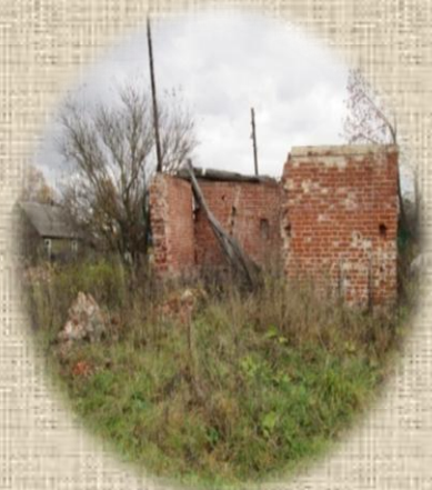
Здесь стоял Кавской храм. От него остались лишь фрагменты сторожки.