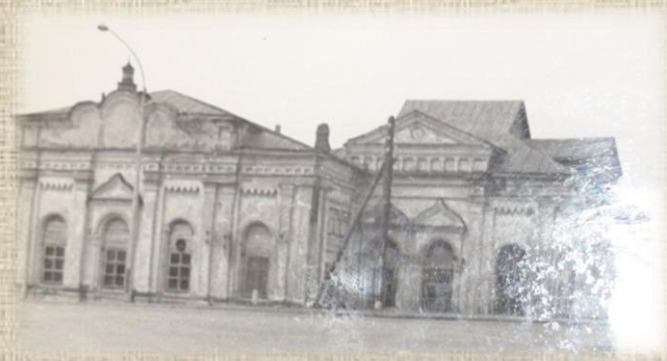
Так выглядела разорённая церковь до начала 1990-х гг.

А вот то, что могильные плиты и памятники с погоста были использованы для дорожного строительства - правда. Не так давно на одной из улиц города, далеко от храма, обнаружили старинную плиту с церковного погоста, служившую много лет в качестве мостика через канавку.