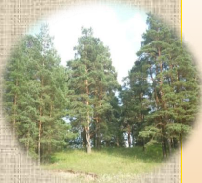
Холм на Красной Горке

Происхождение названия села Толмачи народная легенда связывает с временами татаро-монгольского ига. В XIII-XIII вв. село было местом сбора дани, где жили толмачи - переводчики.