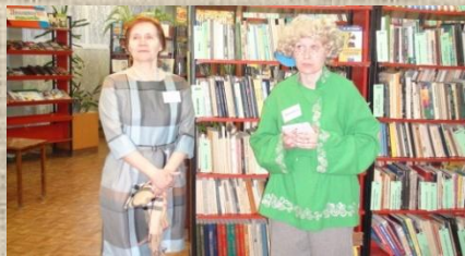
Лиховёнок на «Библионочи»

Со временем миф о призраке забылся. И тогда библиотекари придумали и воплотили в жизнь новый мифический персонаж. Впервые Лиховёнок, «житель Лиховидовского болота», появился перед читателями на мероприятиях «Библионочи – 2014». Любознательный, симпатичный, кудрявый и веснушчатый Лиховёнок стал неизменным проводником по «Библионочи» и уже успел полюбить лихославльцам. Библиотекари придумали Лиховёнку историю о его предках - деде Лиховеде и отце Лиховиде. Этот персонаж вполне может стать своеобразным символом, брендом нашего молодого города.