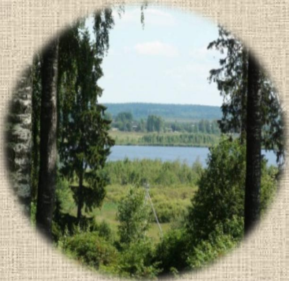
Вид из п. Льнозавод

Как гласит легенда, во времена татарского нашествия к деревне Кратусово, что на реке Кава (около двух километров от Лихославля) вышел один из отрядов татар. Спрашивали дорогу на Торжок, и местные крестьяне направили их на запад, а потом с горы смотрели, как тонут в болотной топи кони и татарские воины. Вот откуда такие «лихие» названия: Лихославка, Лиховидово (деревня поблизости), Лихославль.