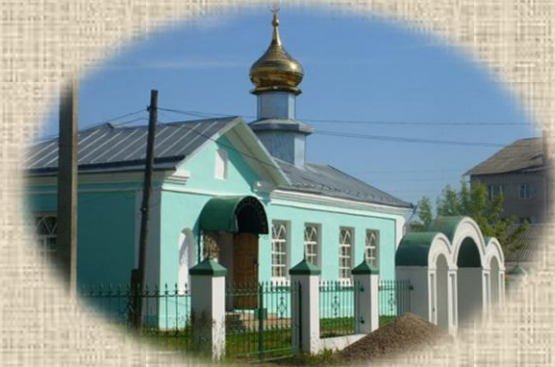
Новая церковь в посёлке появилась в середине 1990-х гг.