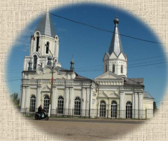
Церковь в наши дни