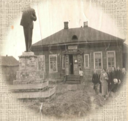
1950-е гг. Старое здание библиотеки

До 1983 года Лихославльская районная библиотека располагалась в старом деревянном здании на улице Советской. На этой улице (бывшей станции) стояло много каменных и деревянных домов, построенных в конце XIX - начале XX вв. купцами и торговцами. И среди сотрудников и читателей библиотеки возник миф о том, что ночью по библиотечному помещению бродит призрак купца Жукова, которому этот дом принадлежал до революции. Этот миф будоражил фантазию читателей. Даже когда в 1983 году библиотека переехала в новое здание на улицу Первомайскую, история о призраке долго жила в памяти людей.