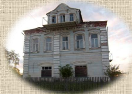
Дом купца Юрасова в с.Микшино

Эти страшные события в годы разгула массовых репрессий дали повод возникновению мифа о том, что сёла были умышленно подожжены вредителями - врагами народа. Миф мифом, но, как бы то ни было, одно за другим выгорели именно два самых крупных села Лихославльского района!