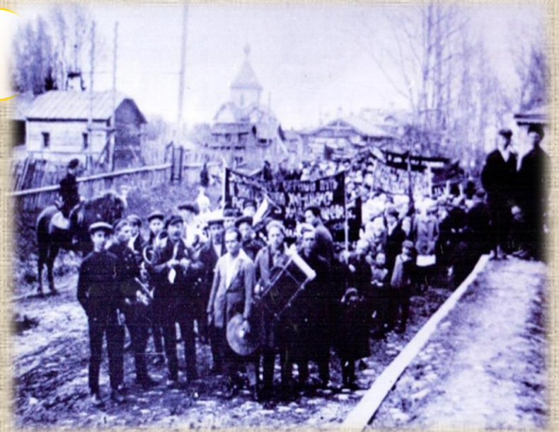
Калашниково. Конец 1920-х – начало 1930-х гг. На заднем плане виден храм.

На самом деле здание бывшей церкви ещё 12 лет служило посёлку: в нём размещались школьные мастерские. Оно было разрушено при бомбёжке в годы Великой Отечественной войны, в 1942 году.