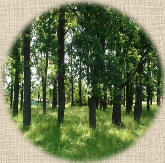
Аллея в бывшем имении Лихославль (ныне – п.Льнозавод)

Благодаря рассказу старожила, сохранились сведения об одном из лихославльских помещиков, который ещё до 1861 года дал «вольную» всем своим крепостным крестьянам. По легенде во время похорон этого «доброего барина» благодарные крестьяне несли гроб с его телом на руках от имения до самого городского кладбища (более двух километров). К сожалению, неизвестно, точно ли это был помещик Лесковский.