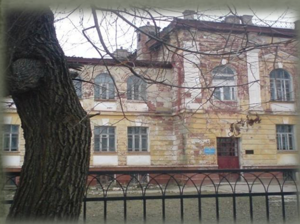
Средняя школа №7 2007 г.