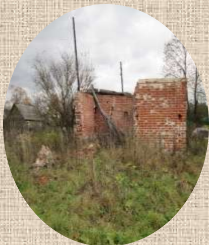
Здесь стоял Кавской храм. От него остались лишь фрагменты сторожки.