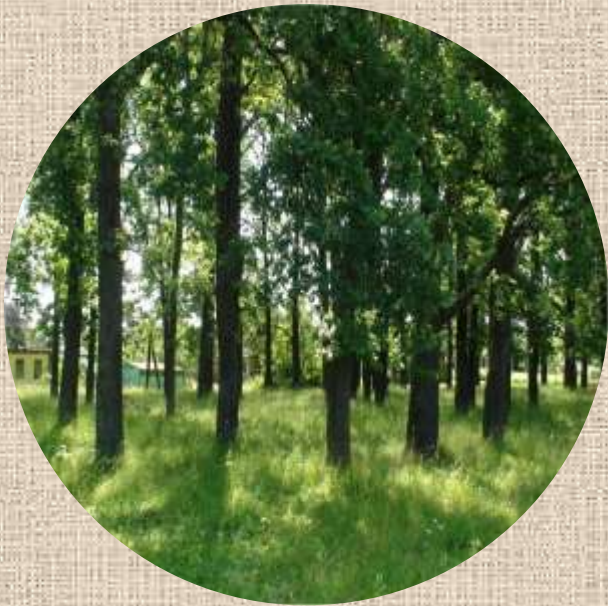
Аллея в бывшем имении Лихославль (ныне – п.Льнозавод)

Благодаря рассказу старожила, сохранились сведения об одном из лихославльских помещиков, который ещё до 1861 года дал «вольную» всем своим крепостным крестьянам. По легенде во время похорон этого «доброего барина» благодарные крестьяне несли гроб с его телом на руках от имения до самого городского кладбища (более двух километров). К сожалению, неизвестно, точно ли это был помещик Лесковский.