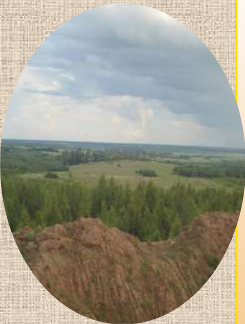
Вид с бывшего холма близ д. Данильцево

Похожая легенда существует и в деревне Вёски. Только в этой местности говорили, что где-то под Вёсками вместе с князем похоронены и воины его дружины.