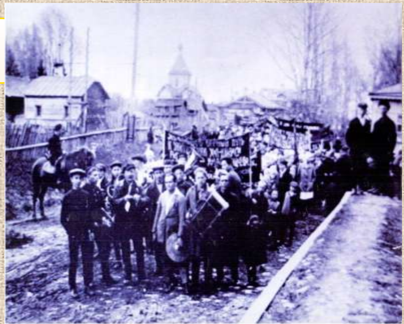
Калашниково. Конец 1920-х – начало 1930-х гг. На заднем плане виден храм.

На самом деле здание бывшей церкви ещё 12 лет служило посёлку: в нём размещались школьные мастерские. Оно было разрушено только в годы войны, в 1942 году.