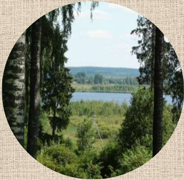
Вид из п.Льнозавод