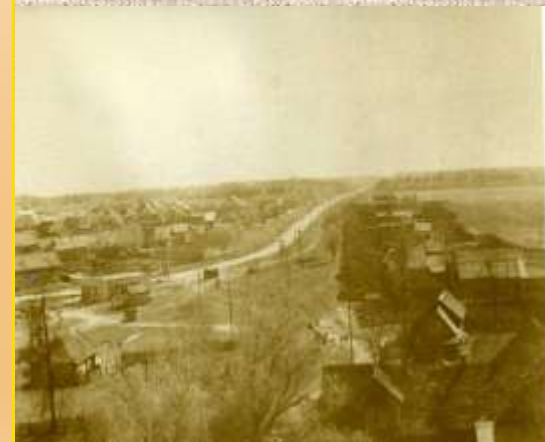
Улица в с.Толмачи