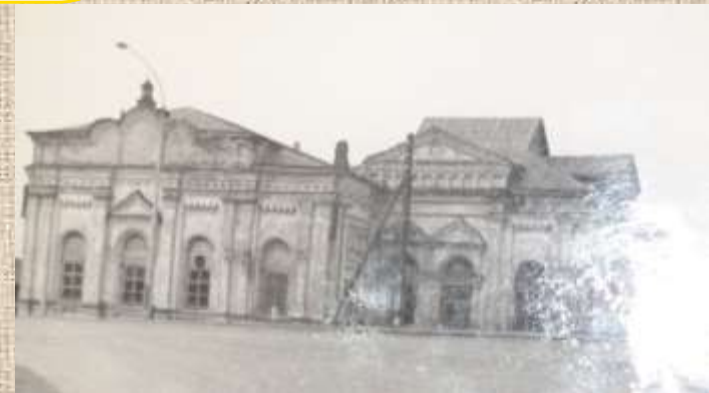
Так выглядела разорённая церковь до начала 1990-х гг.

А вот то, что могильные плиты и памятники с погоста были использованы для дорожного строительства - правда. Не так давно на одной из улиц города, далеко от храма, обнаружили старинную плиту с церковного погоста, служившую много лет в качестве мостика через канавку.