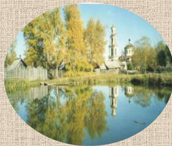
Сегодня Толмачевский храм вновь действует.