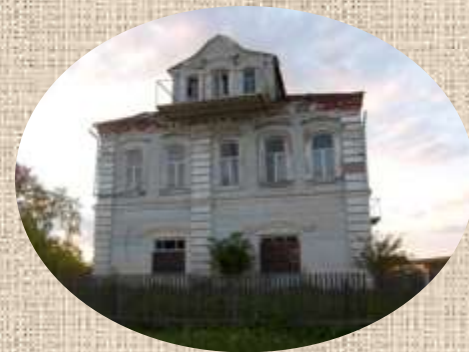
Дом купца Юрасова в с.Микшино

Эти страшные события в годы разгула массовых репрессий дали повод возникновению мифа о том, что сёла были умышленно подожжены вредителями - врагами народа. Миф мифом, но, как бы то ни было, одно за другим выгорели именно два самых крупных села Лихославльского района!