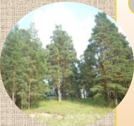
Холм на Красной Горке

Происхождение названия села Толмачи народная легенда связывает с временами татаро-монгольского ига. В XIII-XIII вв. село было местом сбора дани, где жили толмачи - переводчики.