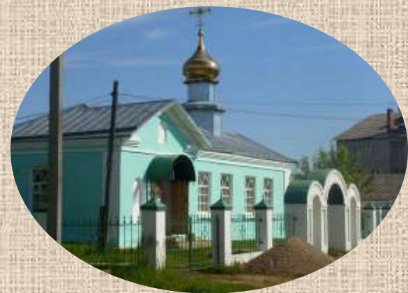
Новая церковь в посёлке появилась в середине 1990-х гг.