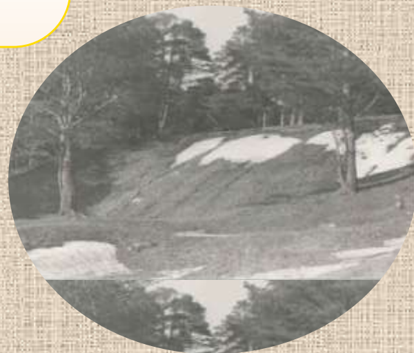
Когда-то на этом холме стояла церковь и было кладбище...

Миф или легенда следующая история – в наши дни уже выяснить трудно. Но некоторые рассказывали, что во время массовых репрессий середины 1930-х гг. сотрудники НКВД приехали арестовывать священника Толмачевской церкви. Им оказал сопротивление дьяк (или дьякон?). Его расстреляли прямо у церкви, возле трупы выставили охрану. Дело было летом... На третью ночь тело дьяка унесли две монахини и тайно захоронили где-то в окрестностях села.