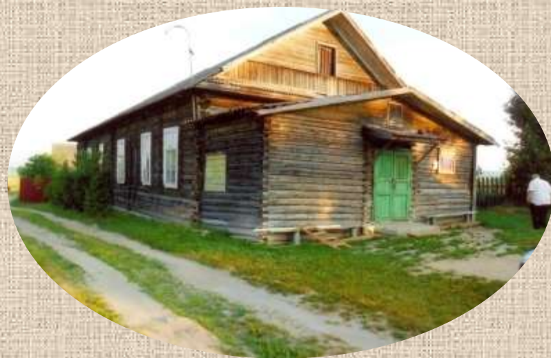
Гнездовский клуб размещался в перевезённой от кладбища в центр деревни церкви

Впоследствии колокольня была разрушена до основания, но ценности так и не нашли.