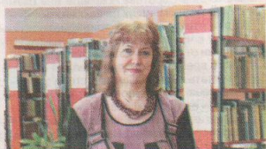
Виктория г. Лихославль