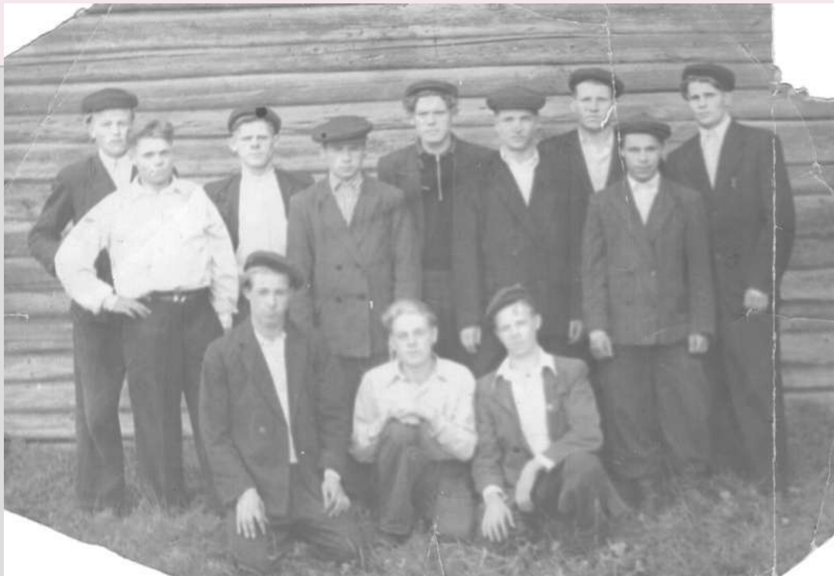
Деревня Бор, 1950-е годы.