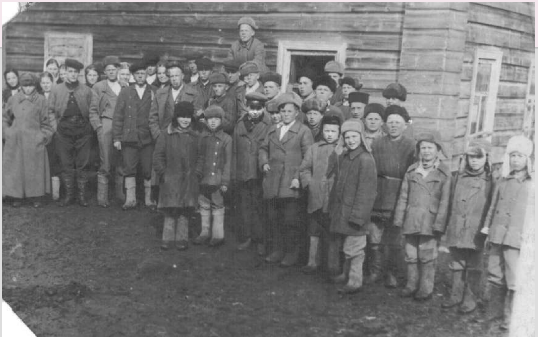
Деревня Бор, 1950-е годы.