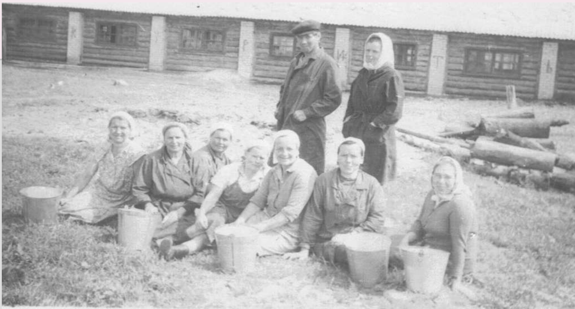
Доярки и бригадир фермы деревни Бор. 1970-е годы.