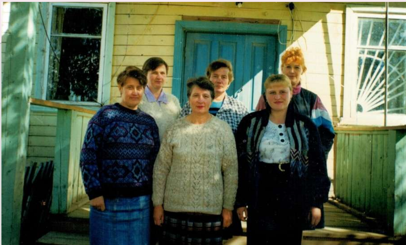
Работники бухгалтерии в новой конторе. 1990-е годы.