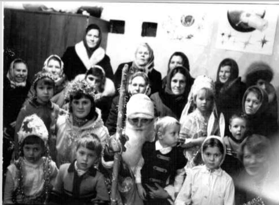
Деревня Бор, детский новогодний утренник в колхозном клубе. 1986 год.