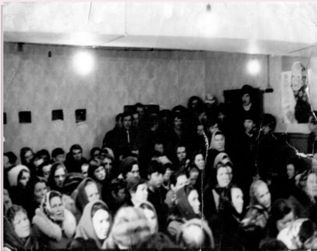
1991 год, колхозный клуб.