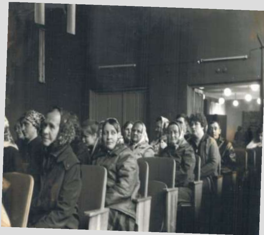
1987 год, Дом культуры.