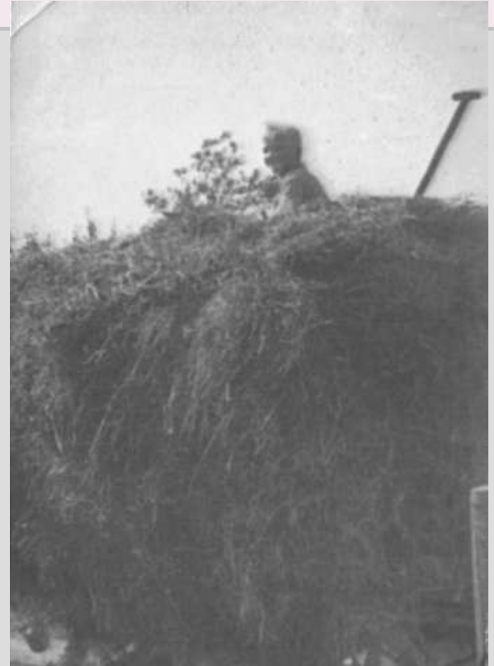
Колхозники из деревень Курочкино и Бор. 1960-70-е годы.