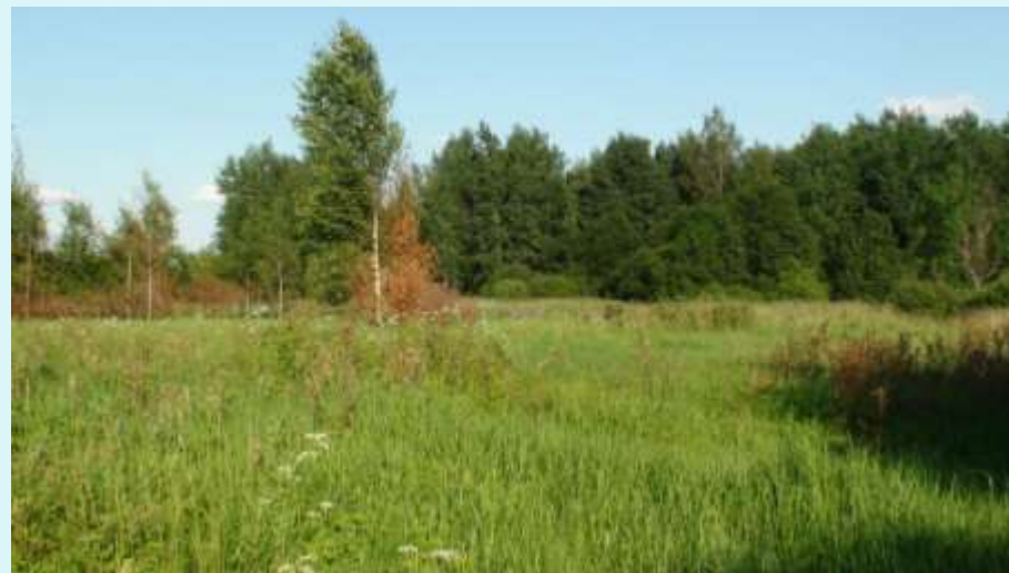
На месте бывшей усадьбы Катино. 2015 г.