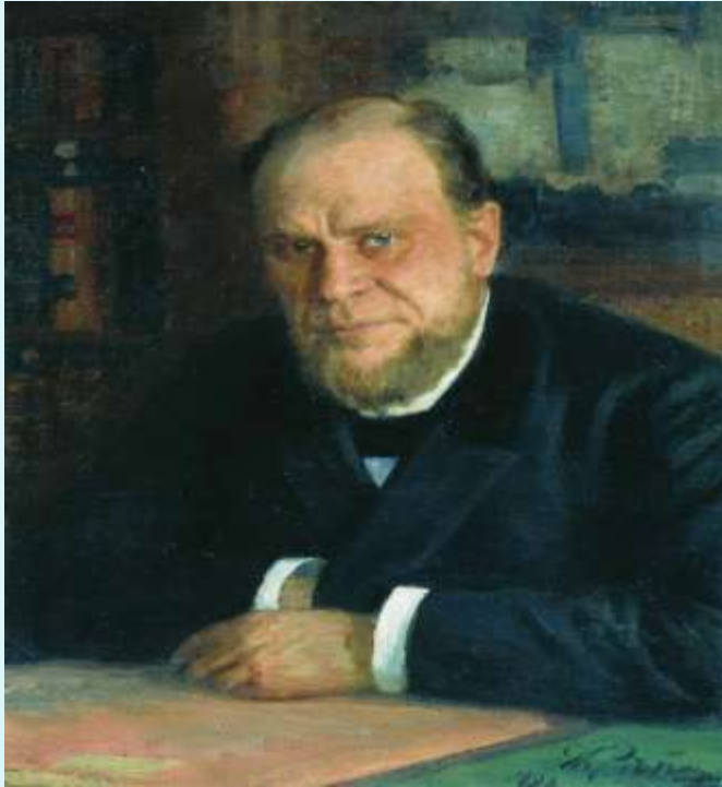
Портрет А.Ф. Кони. Художник И. Репин (1898)

Гольдовские хорошо знали князя Александра Ивановича Урусова – русского юриста, адвоката, выдающегося судебного оратора. Р.М.Хин-Гольдовская написала воспоминание "Памяти князя А.И.Урусова", где дала характеристику его личности и литературным интересам.