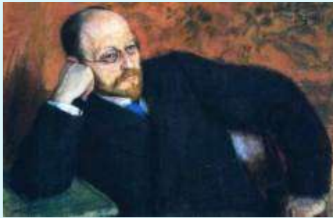
Викентий Вересаев . Портрет работы С.Малютина (1919)

Вот что рассказал писатель Викентий Вересаев в очерке «Р.М.Хин»: