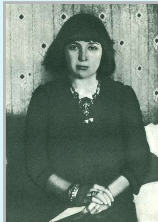
Марина Ивановна Цветаева. 1914.