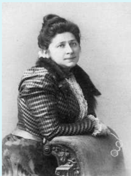
Р.М.Хин-Гольдовская (1863 – 1928)

Рашель Мироновна Хин–Гольдовская - писательница-беллетристка рубежа веков. Её повести и рассказы печатались в «Вестнике Европы», «Русской мысли», «Неделе», «Восходе». Главные темы этих произведений - жизнь русской интеллигенции, небогатых помещичьих семей и российских интеллигентных евреев, которым приходится делать выбор между любовью к воспитавшей их русской культуре и любовью к родному племени.