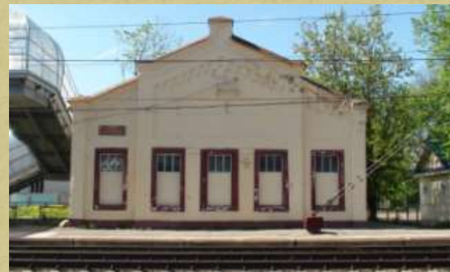
Перрон и старый вокзал на станции Лихославль. Отсюда уходили на фронт наши земляки.