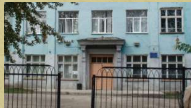
Сегодня старое здание школы №1 – лишь часть школьного комплекса.