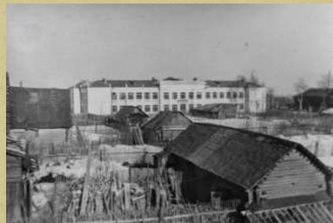
На этом фото начала 1960-х годов - вид здания Лихославльской средней школы № 1 и старых строений улицы Первомайской. Так же улица выглядела и в 1940-е годы.