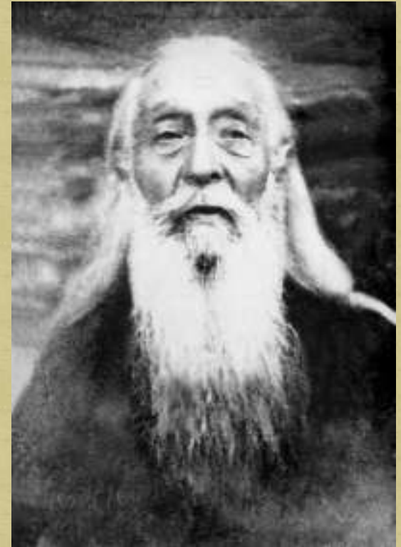
О.Митрофан (в монашестве архимандрит Сергей Сребрянский) в 1930-х гг. был переведён в д.Владычня из дальней ссылки, до которой был наставником Марфо-Мариинской обители. Прославлен в лике святых Русской православной церкви в 2000 г.

Не знаю, это ли определило мою судьбу, но мне довелось вернуться с войны практически здоровым, отделавшись одним не очень серьёзным ранением.