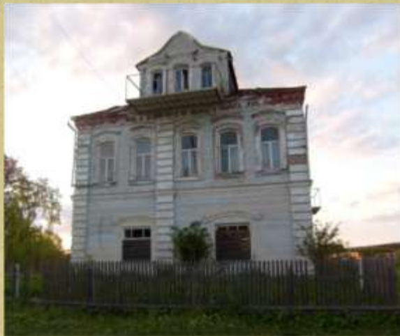
Старинный дом купца Юрасова в селе Микшино. В начале войны здесь был временный госпиталь.

Проучился я в 10 классе первых две четверти, после чего нас сочли нужным аттестовать как окончивших полный курс средней школы и призвали в армию.