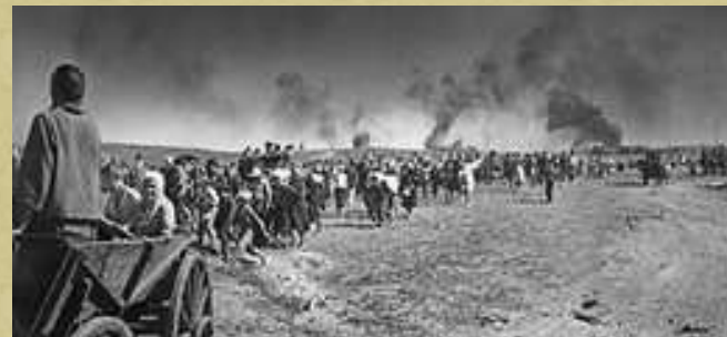
Беженцы. Фото времён Великой Отечественной войны из ресурсов интернета.

Войска противника быстро продвигались вперёд. Красная Армия отступала с боями, неся большие потери. Фронт приближался, подошёл уже вплотную к нам. Отец соорудил ручную тележку, и мы готовились вот-вот присоединиться к другим семьям беженцев, движущимся в направлении на Лихославль и далее на Микшино – Толмачи... Но с места мы так и не сдвинулись – войска немцев продвигались по шоссе Ленинград – Москва, которое от нас было в 15 километрах. Направление же на Лихославль и Толмачи их не интересовало.