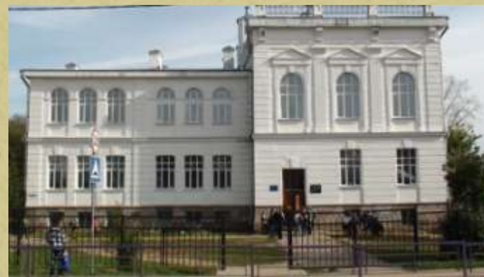
Та самая железнодорожная школа – ныне Лихославльская средняя школа № 7.

О начале войны узнаю от мамы. Её тревога и обеспокоенность меня не затронула. В себе я ощутил какой-то подъём, интерес к ожидаемым большим событиям.