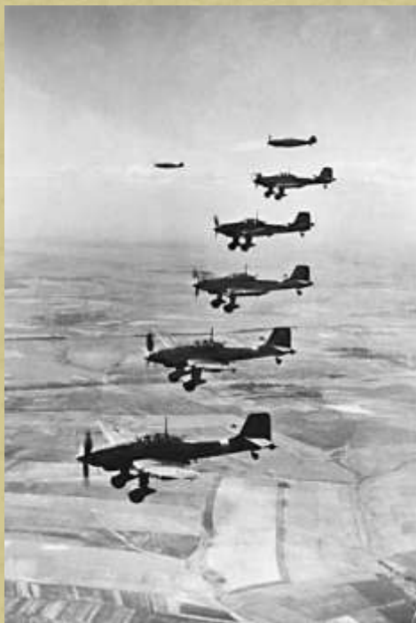
Группа немецких бомбардировщиков.

В тишине августовских и сентябрьских ночей постоянно был слышен отдалённый гул движущейся по шоссе на Тверь тяжёлой техники. Часто можно было слышать гул больших групп бомбардировщиков, идущих на средней высоте в сторону Москвы.