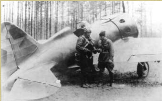
И-16 ("Ишак") - основной советский истребитель в начале войны. Фотография сделана осенью 1941 г. на Ленинградском фронте.

Однажды днём жители Владычни увидели, как два советских истребителя успешно атаковали такую группу: где-то в 3-5 километрах от деревни один из бомбардировщиков рухнул горящим факелом на землю, остальные повернули обратно.