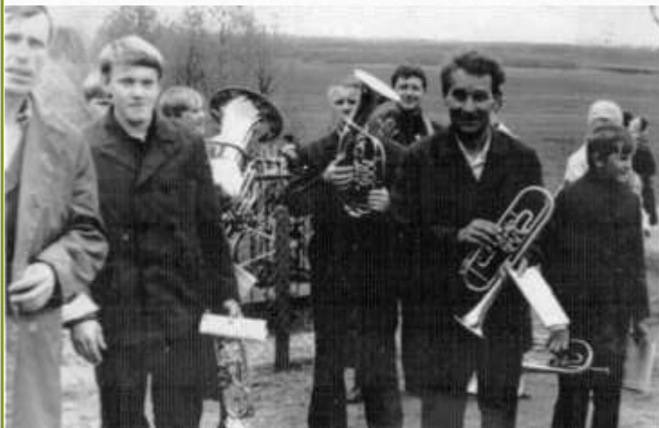
Фото 1970-х гг.