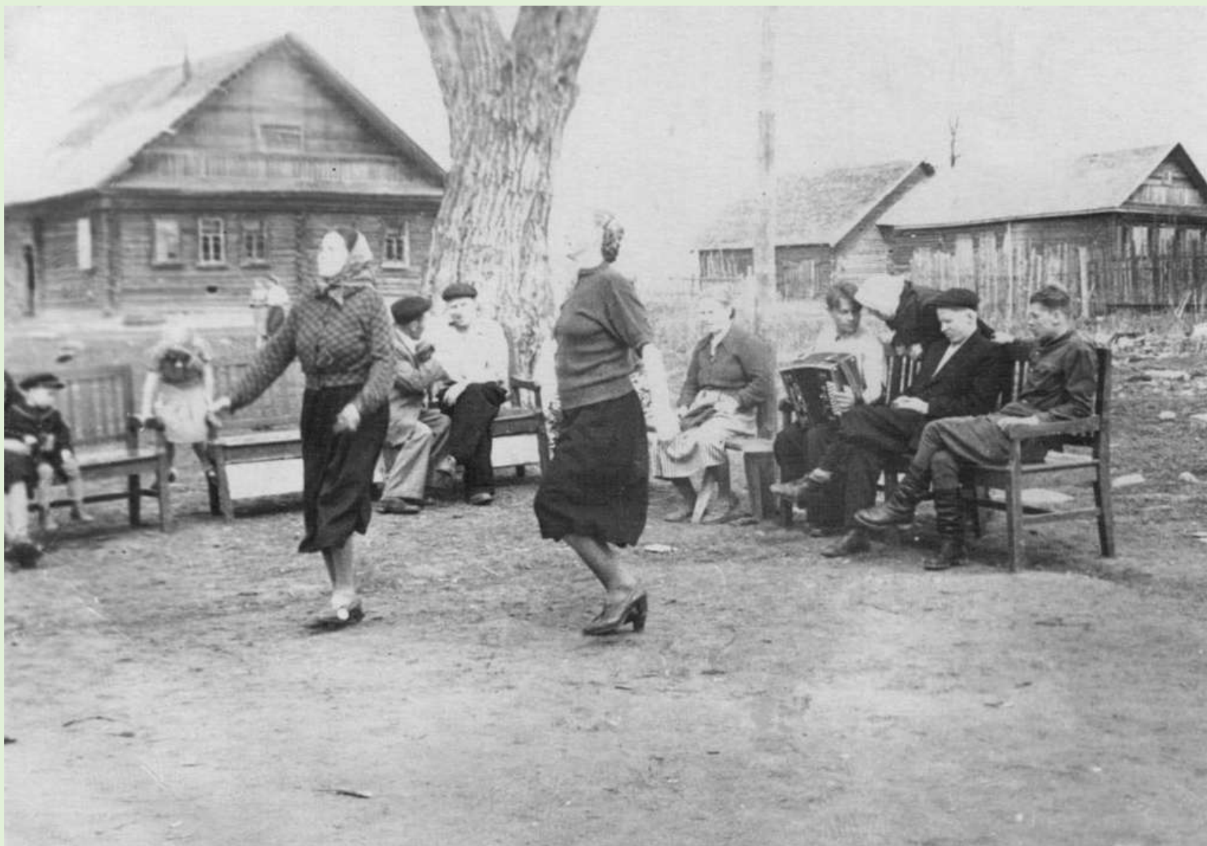
Деревня Ананкино. Пляски у старой ветлы. 1950-е годы.