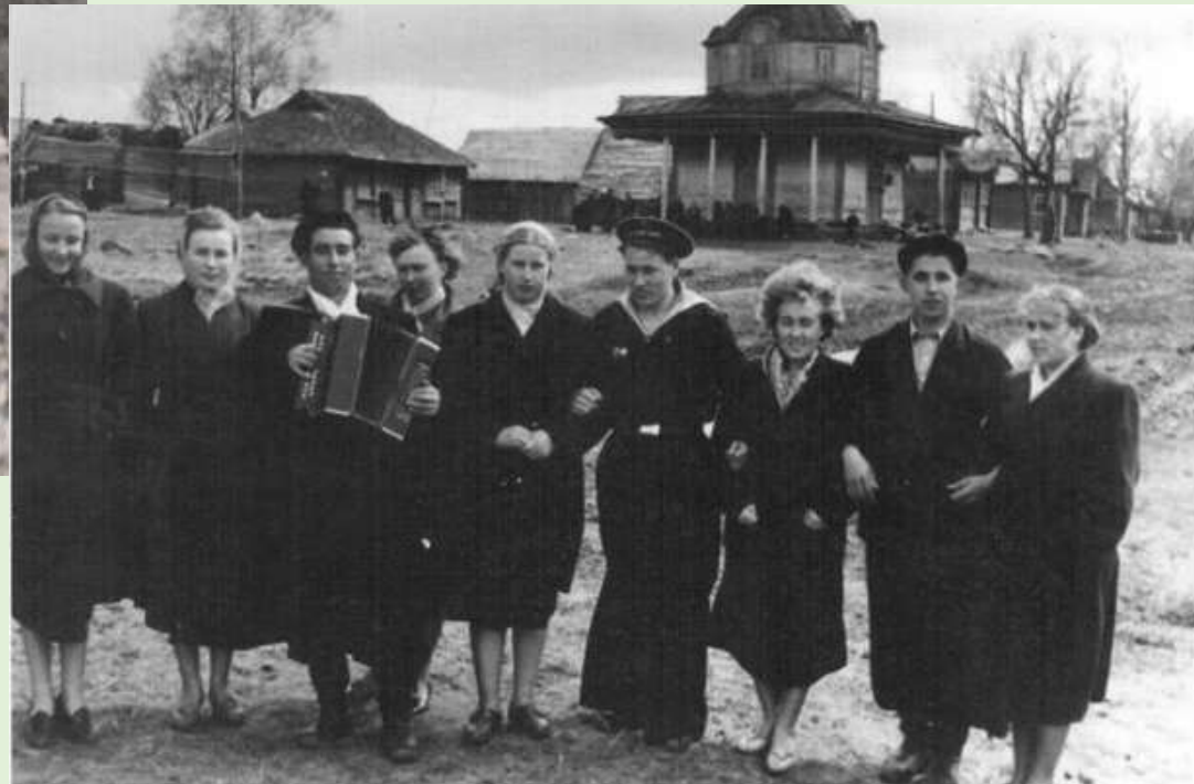
Гулянье в д. Ананкино. 1950-е гг.