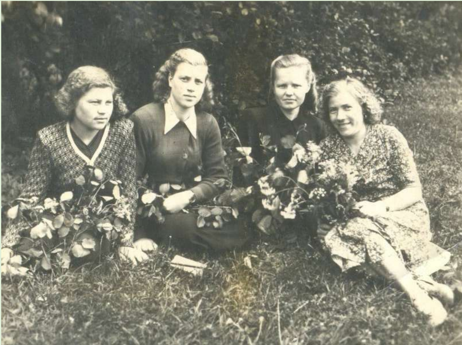
Залазинские девушки. 1953 г.