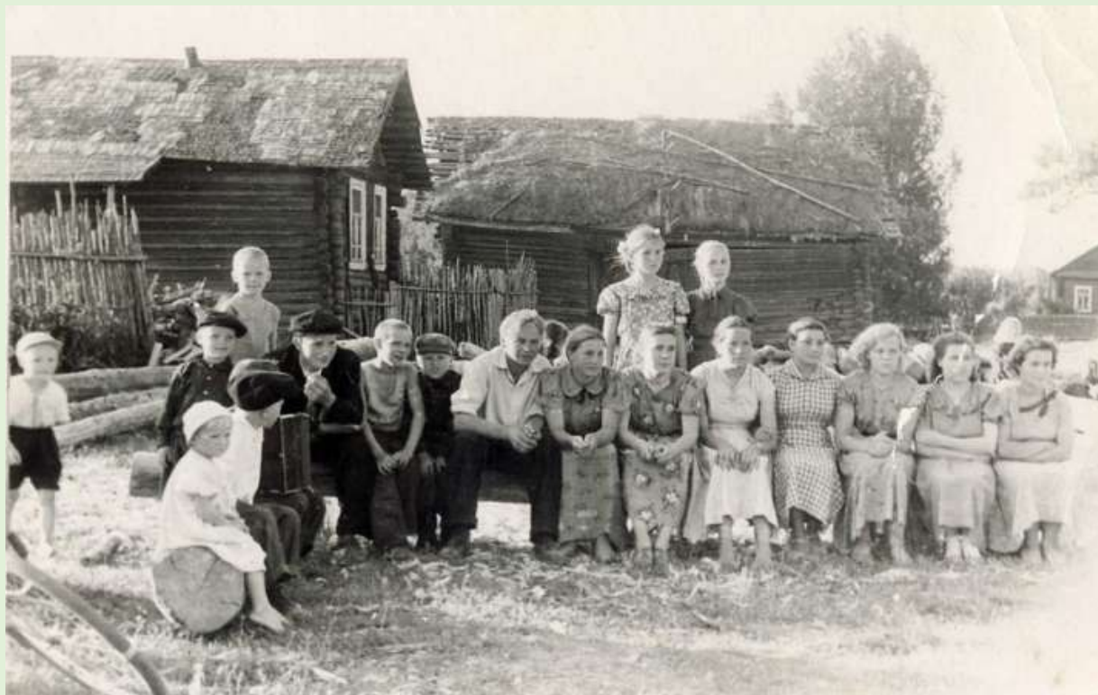
Праздник в деревне Поповка. 1959 год.

Веселей раньше жилось. Хоть и холод и голод видели, а веселей умели гулять...».