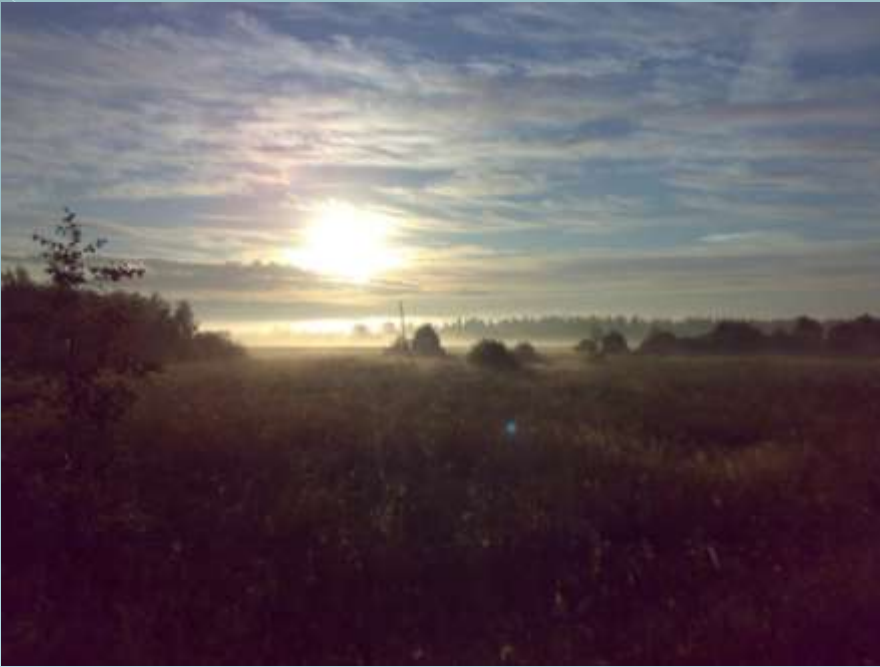
В окрестностях села Залазино