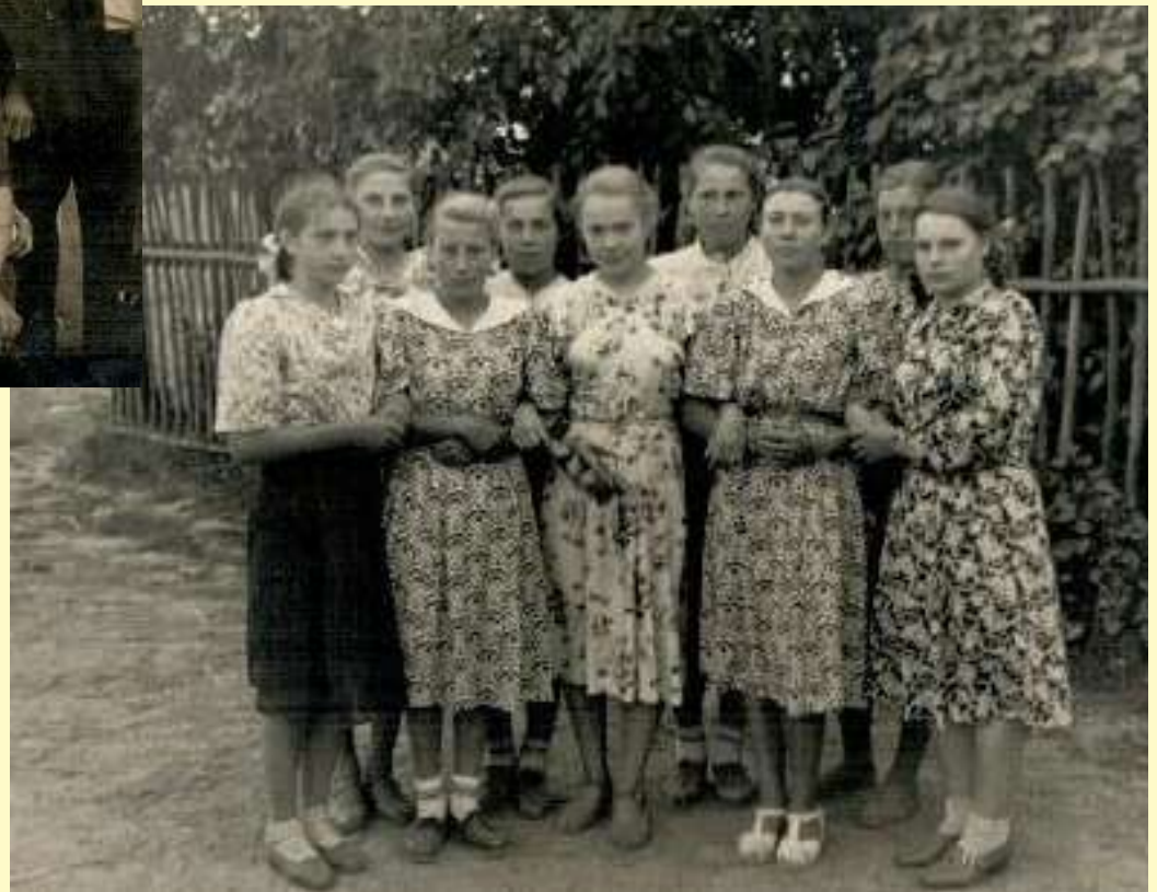
Бочельниковские девчата на улицах деревни в праздник «Смоленской». 1955 год.