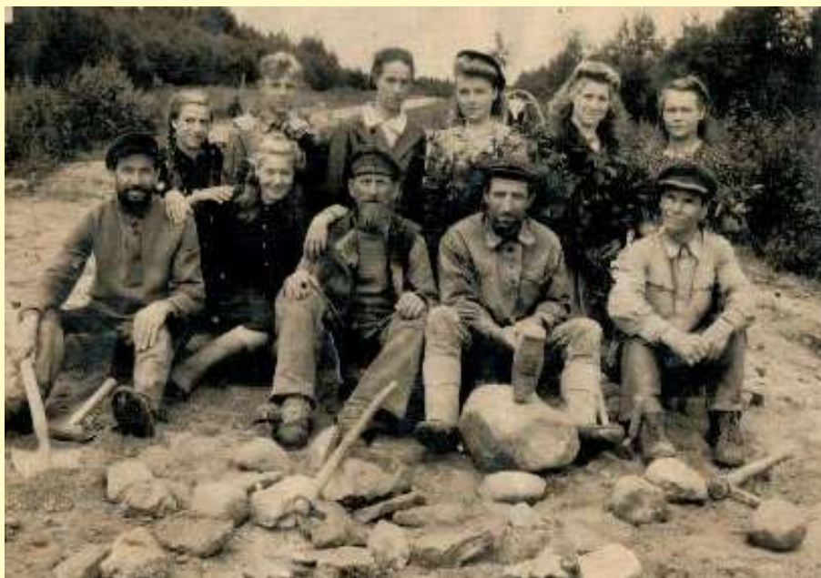
Жители Бочельникова на работе по мощению дороги «Лихославль – Первитино». 1940-е годы.

В те годы на селе требовались квалифицированные специалисты. Поэтому случалось, что целые группы деревенской молодёжи направляли учиться в сельскохозяйственные техникумы.