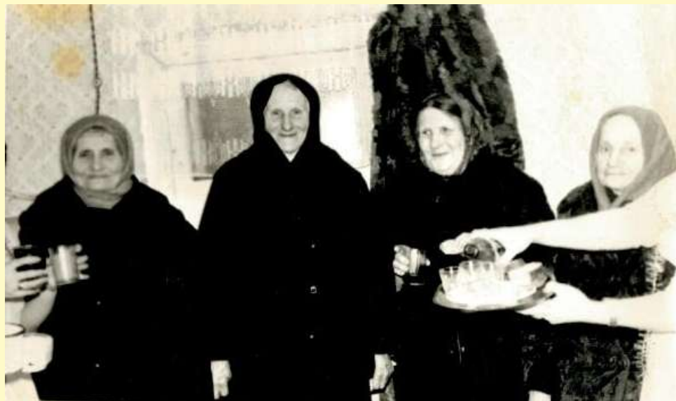
Старшее поколение соблюдало обычаи старины. Так, поздравить молодых на свадьбе непременно приходили старожилы деревни. По традиции, поздравляющим полагались особое почтение и угощение. Фото 1980-х годов.