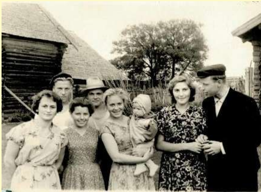
В праздничный день на улицы деревни выходили все её жители от мала до велика. 1960-е годы.