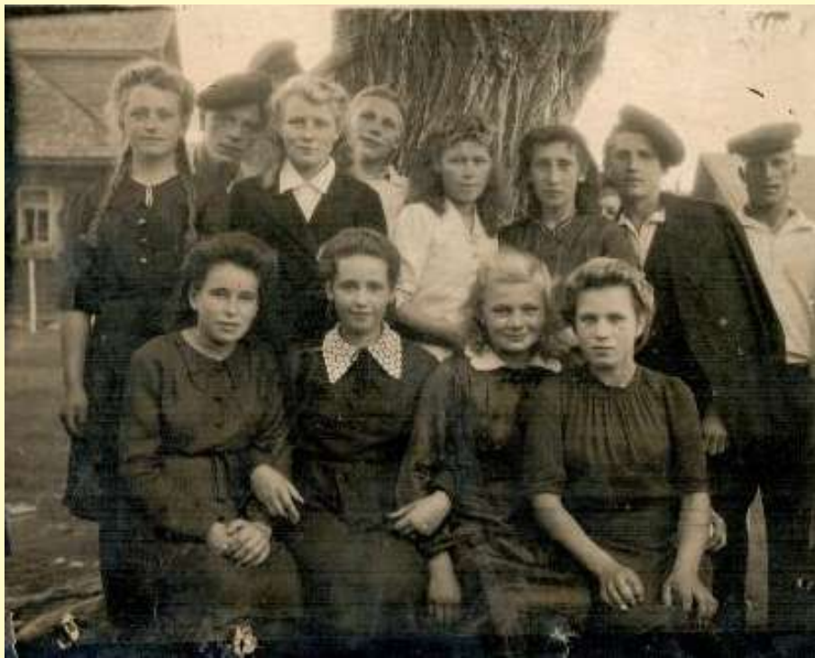
«Смоленская», 1947 год.