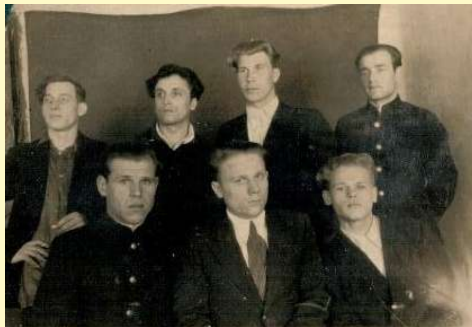
Будущие специалисты. 1950-е годы.