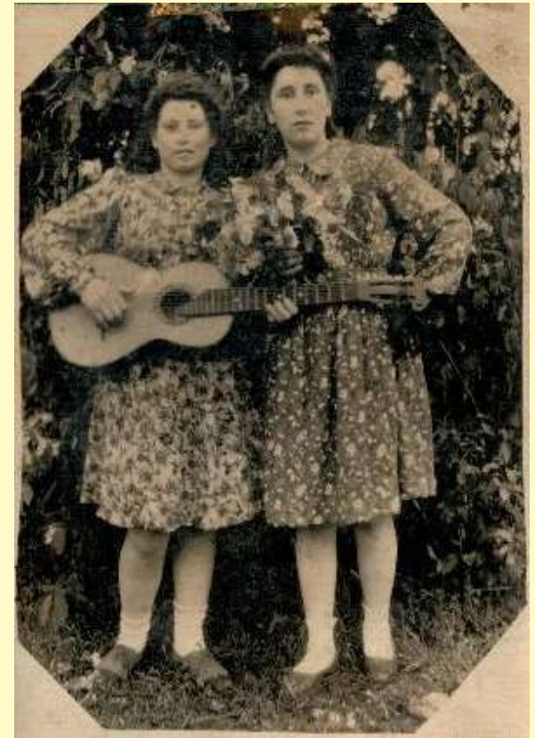
Девушки с гитарой. Бочельниково, середина XX века.