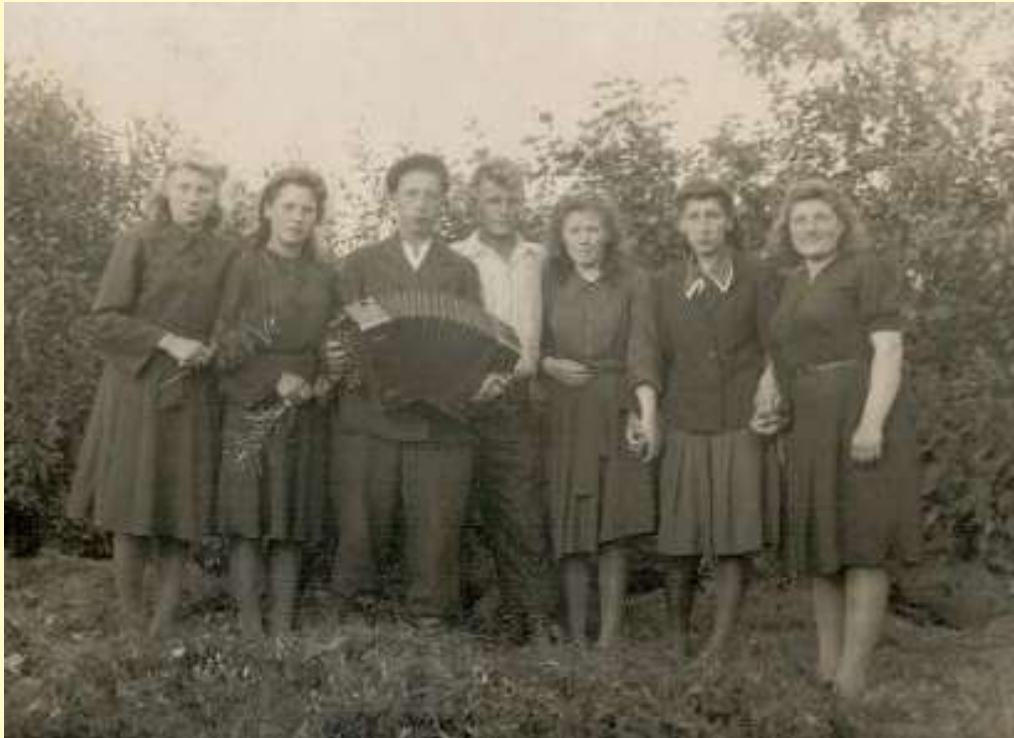
«Смоленская» в Бочельникове. Середина XX века.

Престольными праздниками деревни Бочельниково были «Смоленская» (10 августа) и «Грязная Прасковья» (10 ноября). Несмотря на отрицательное отношение советской власти к празднованию религиозных праздников, традиция отмечать их жила и передавалась из поколения в поколение. Даже во второй половине 20 века на гуляния, посвящённые «Смоленской» и «Грязной Прасковье», собирались жители как Бочельникова, так и близлежащих деревень и даже Вышкова.