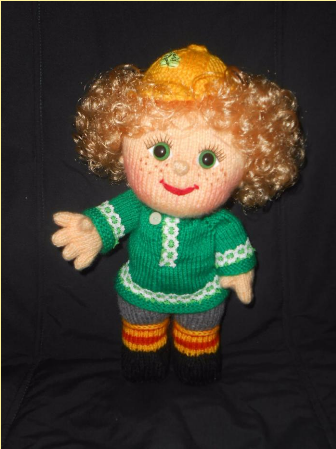
Лиховёнок работы Надежды Морозовой. 2016 г.

- Вот что сказывают про меня и моих родных библиотекари.