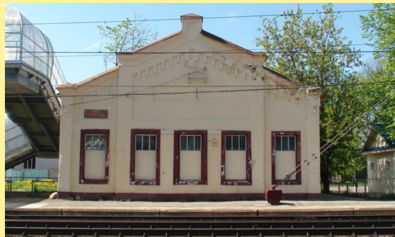
Здание старого железнодорожного вокзала станции Лихославль в наши дни.

...Сороки длиннохвостые до нашего болота отрадные новости донесли. Станцию Осташково, на коей железные чудовища останавливаются и брюхо водой заливают, по-новому назвали. А уж так ли славно назвали, что я, узнав о сем, чрезвычайно возликовал. Самое оно наше имечко! Пусть во веки веков сохраняется!».