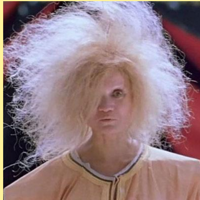
Лихо Одноглазое – родоначальник «лихой» династии. Таким Лихо предстало в советском кинофильме-сказке «Там на неведомых дорожках...» (1983 г.).

Во времена татаро-монгольского нашествия Лихо безжалостно утопило в здешних болотах целый отряд татарских воинов-захватчиков, вторгшихся в его вотчину. Это событие упрочило славу Лиха и навеки закрепило её в местных топонимах и гидронимах.