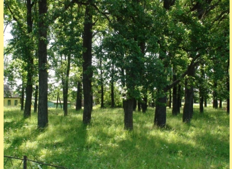
Мошинская роща в посёлке Льнозавода – остатки былого великолетия усадьбы.

Вот кабы мне на болоте так развернуться!».