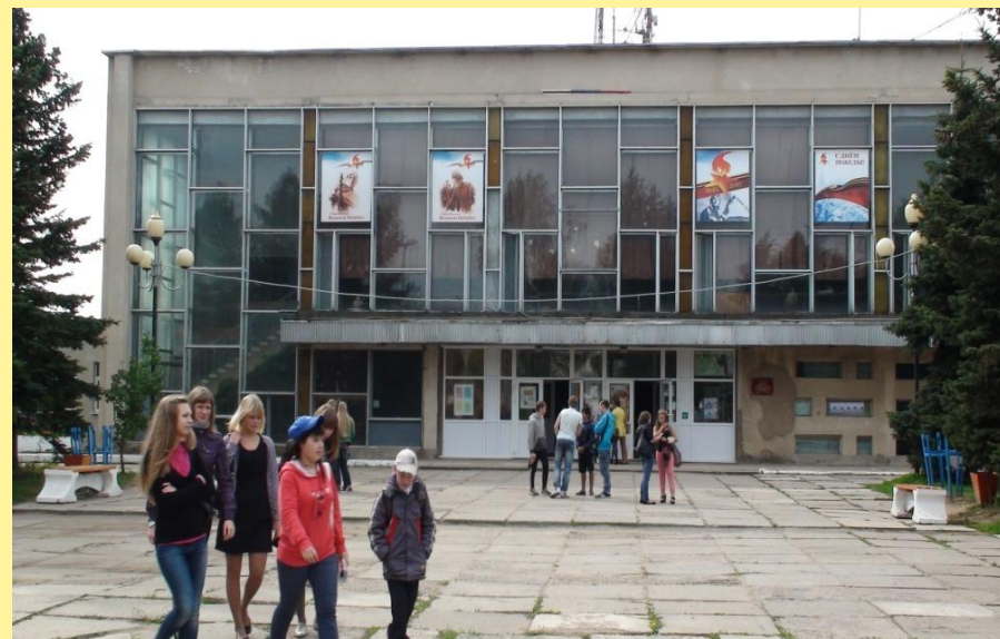
Дом культуры имени 40-летия Победы (РЦКиД) построен на месте бывшего базара.

... Давненко не был я на городском базаре. А тут понадобилось мне прикупить кое-что по хозяйству. Пришёл на рынок - и обомлел: на его месте новый дом стоит, вся стена цветными стекляшками украшена, стёкла светлые и большущие, сквозь них внутри колонны видны, лестница широченная. Говорят, дом... - вот чего дом, не помню, слово такое неведомо мне пока...».