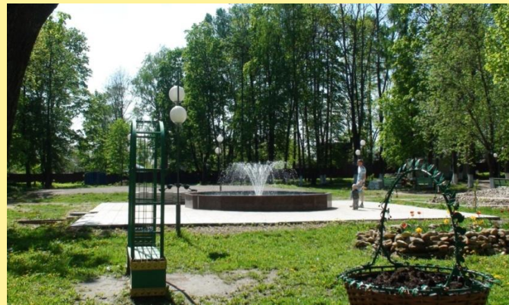
Лихославльский горсад в 2000-х гг. возродился из небытия.