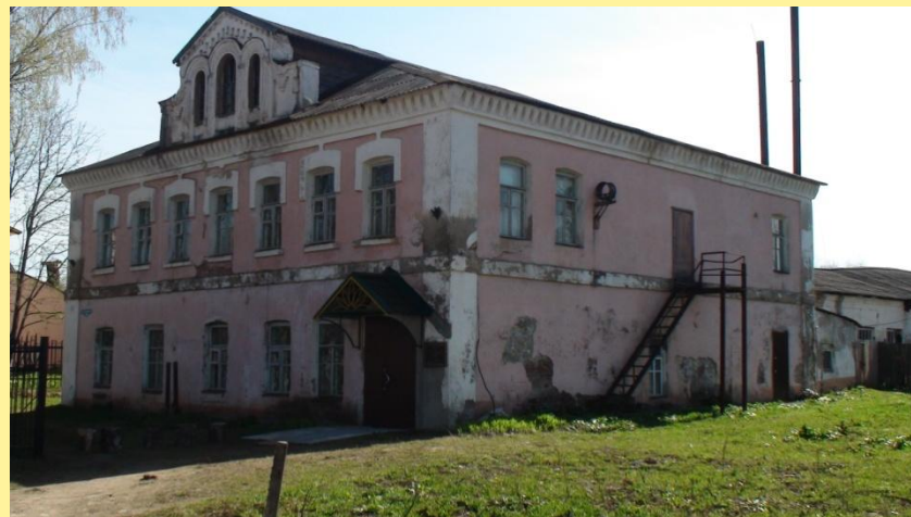
Карельский краеведческий музей.

...Что за странное заведение основали недалеко от вокзала? Стоят там разные чучела зверей, птиц, вещи какие-то старинные лежат. Приценился я, что почём. Да не тут-то было! «Не продаются», - говорят. Вернулся я на болото и решил, что тоже буду всякие редкости собирать. Пригодится!».