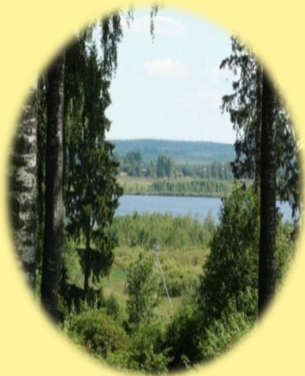
Вид на Лихославльское озеро из п.Лынозавод

Как гласит легенда, во времена татарского нашествия к деревне Кратусово, что на реке Кава (около двух километров от Лихославля) вышел один из отрядов татар. Спрашивали дорогу на Торжок, и местные крестьяне направили их на запад, а потом с горы смотрели, как тонут в болотной топи кони и татарские воины. Вот откуда такие «лихие» названия: Лихославка, Лиховидово (деревня поблизости), Лихославль.