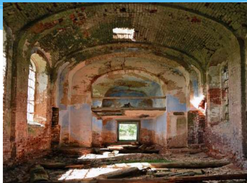
Локотцы. Современное состояние каменного храма Архистратига Михаила.