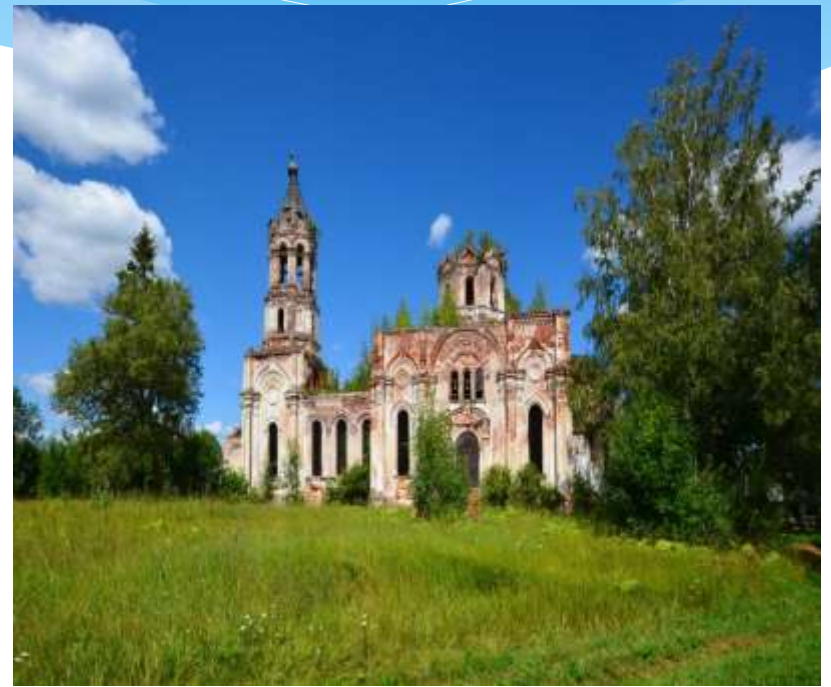
Локотцы. Современный вид храма Архистратига Михаила.

В 1899 году построена и освящена вторая, деревянная церковь Казанской Божьей Матери. В 1903 году церковный участок был обнесен новой оградой.