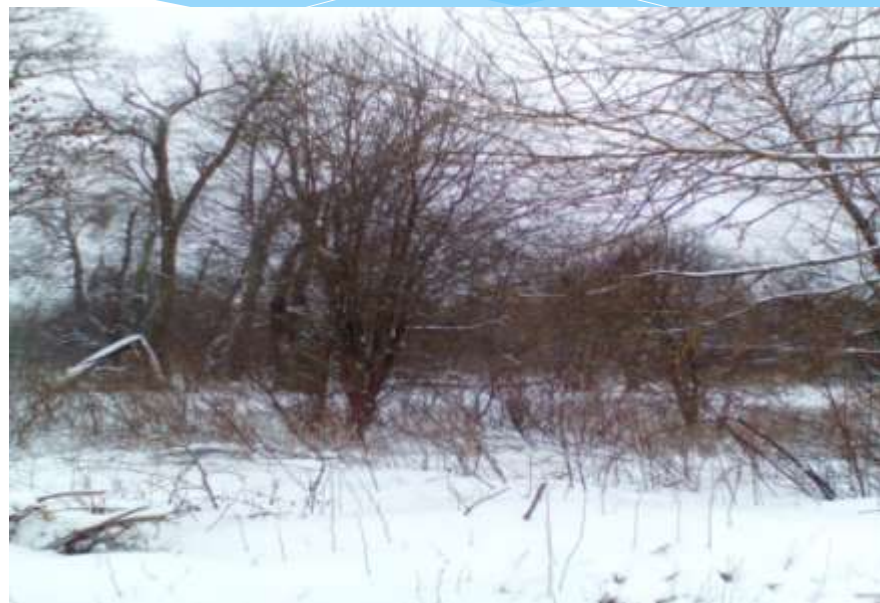
Сад в Тимошкине в наши дни.