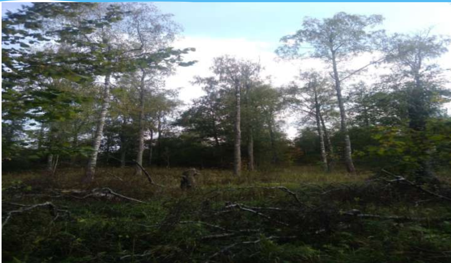
Старинная берёзовая роща в Тимошкине уже в плачевном состоянии: век берёзы недолог, годы взяли своё...