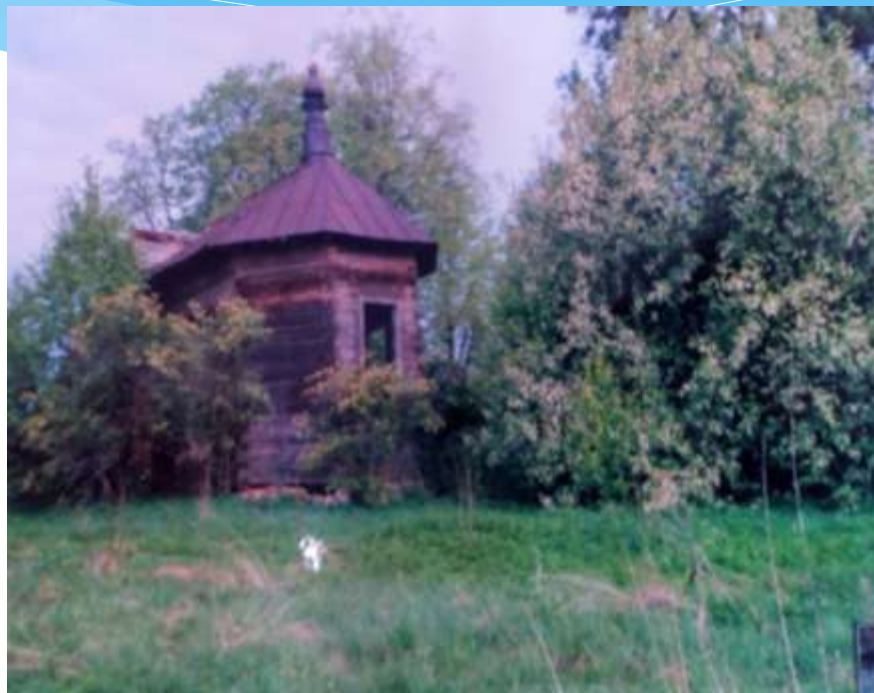
Локотцы. Остатки деревянной Казанской церкви. Конец 1990-х гг.

В Михаилоархангельском храме утрачены значительная часть кровли, настенная живопись, полы и печи, в сводах западной паперти появились трещины. Полностью разрушена церковная ограда.