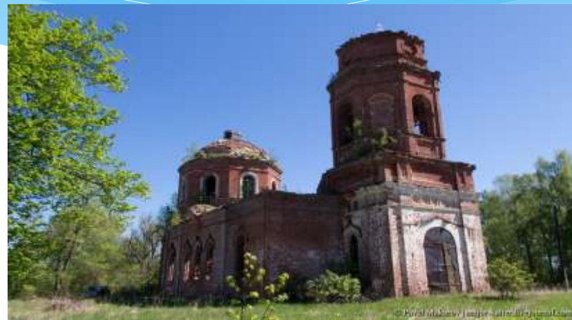
Казанская церковь в наши дни.

В приходе было 13 деревень, 1040 мужчин и 1048 женщин, все карелы.