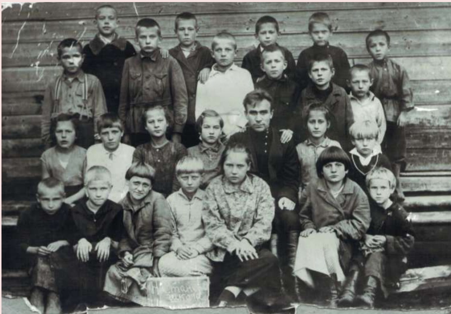
Внизу на фотографии видна надпись: «Н. Станская школа»