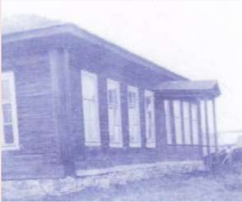
Старая Станская школа