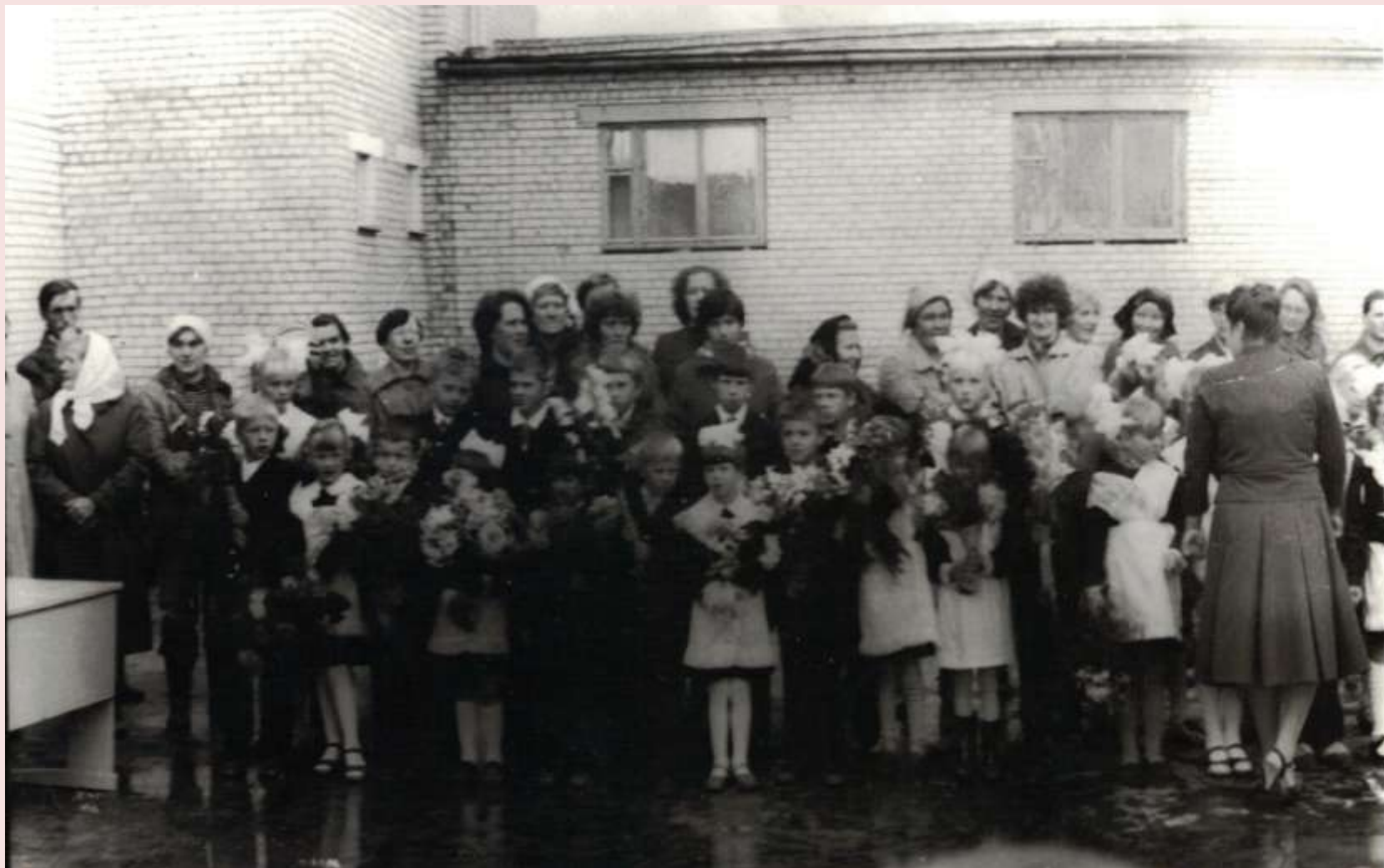
Первые первоклассники новой Станской школы, 1985 – 1986 учебный год.